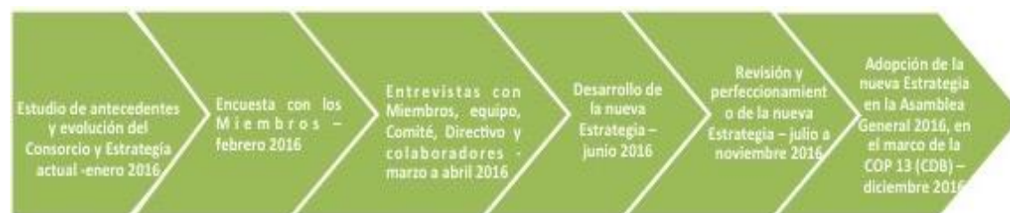
Figura 2. Pasos hacia el fortalecimiento de la Estrategia del Consorcio TICCA

El resumen de la Estrategia actual del Consorcio TICCA presentado en este documento ofrece el primero de una serie de pasos que se llevarán a cabo en 2016 y que han de concretarse en una Estrategia fortalecida, como lo muestra el diagrama abajo (Fig. 2). Se espera que la nueva Estrategia esté completa y sea aprobada durante la Asamblea General del Consorcio que se realizará en Cancún (México) en diciembre de 2016, en el marco de la COP 13 del CDB.